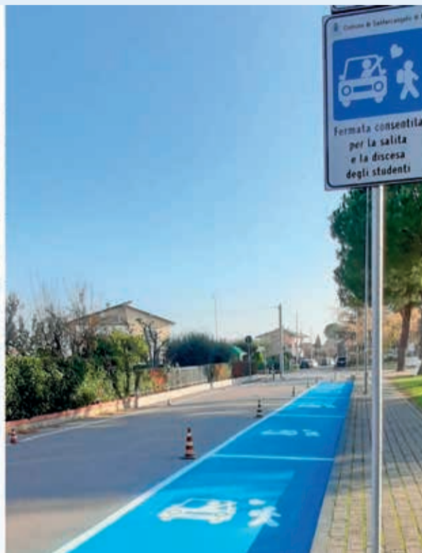
A sinistra il percorso protetto di via Verdi, a destra gli stalli di sosta veloce in via San Marino

soprattutto durante gli orari di ingresso e di uscita degli studenti.