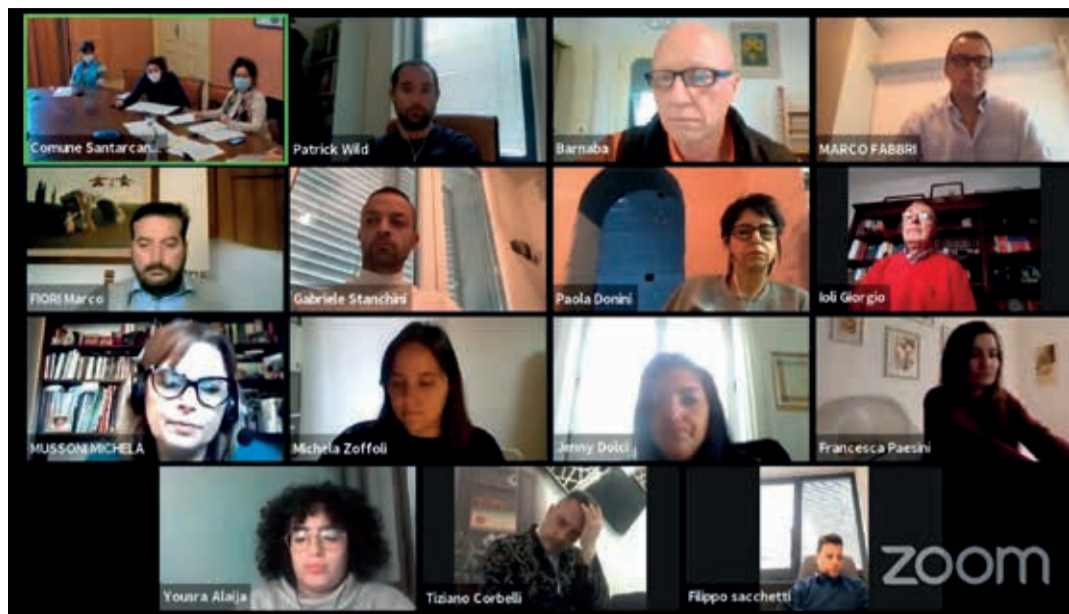
Un momento del Consiglio comunale del 28 novembre che si è tenuto in videoconferenza