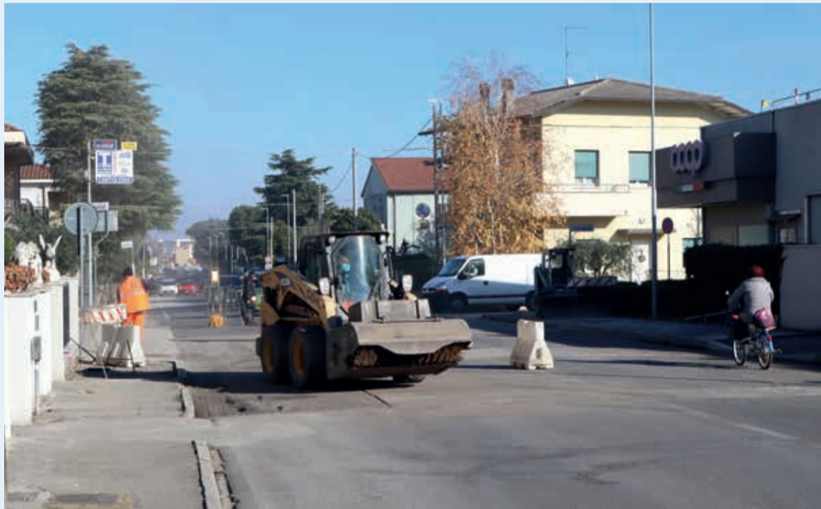
I lavori in corso in via Ugo Bassi

"In via Ugo Bassi i lavori sono finalizzati al contenimento della velocità da parte degli automezzi attraverso la riduzione della larghezza della carreggiata e, di conseguenza, al miglioramento della sicurezza di pedoni e ciclisti. Allo stesso tempo – conclude la vice sindaca Fussi – il percorso protetto e la messa in sicurezza degli attraversamenti migliorano il collegamento della zona "Flora" con il centro città e promuovono un sistema di mobilità sostenibile. In viale Marini, dopo la creazione della strada scolastica all'altezza del plesso della ex Saffi, abbiamo deciso di intervenire su uno degli attraversamenti più frequentati".