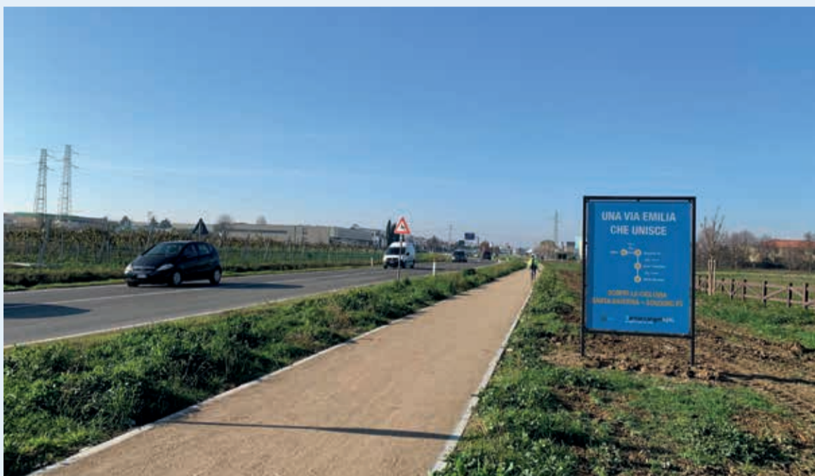
La pista ciclabile e la vasca di laminazione di Santa Giustina

L'ultimo tratto è caratterizzato dall'ampio spazio verde creato per far fronte alle criticità idrogeologiche in caso di piogge eccezionali. L'invaso mette al sicuro il centro abitato di Santa Giustina dagli allagamenti gra-