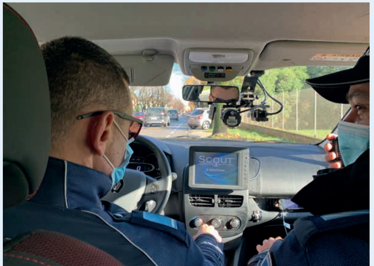
Una pattuglia della Polizia locale Valmarecchia durante i controlli con lo Scout speed

Intanto i controlli della Polizia locale proseguono anche nel mese di dicembre. A Santarcangelo le pattuglie in stazionamento saranno presenti in particolare nelle vie De Gasperi, via Canonica, via Trasversale Marecchia (nella frazione di Sant'Ermete), via Tomba e la Strada Provinciale Uso (Stradone), mentre a Verucchio i controlli riguarderanno la Strada Marecchiese, via Ponte e la Strada Provinciale 32 (Cantelli). A Poggio Torriana infine le pattuglie della Polizia locale Valmarecchia saranno presenti lungo la Santarcangelo, in via Case Nuove e in via Cornacchiara.